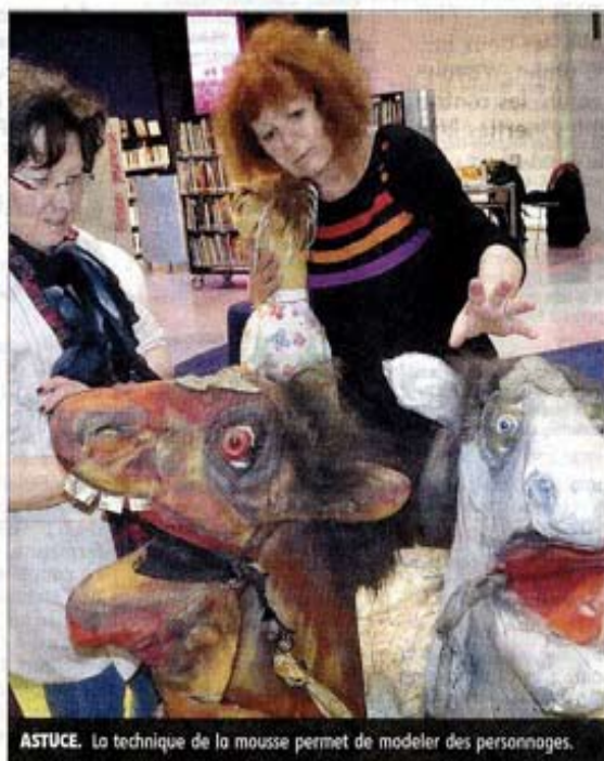
ASTUCE. La technique de la mousse permet de modeler des personnages.

Les personnages sont entourés d'accessoires, mais aussi de petits écrans retraçant leurs exploits.